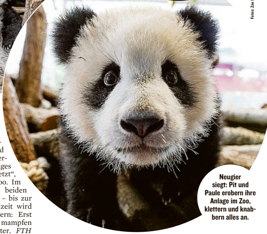
Neugier siegt: Pit und Paule erobern ihre Anlage im Zoo, klettern und knabbern alles an.

Kaumuskulatur, nebenbei werden die kleinen Beißerchen gereinigt. „Die Milchzähne fallen ihnen in der Regel zwischen dem achten und 17. Monat aus und werden durch ein richtiges Panda-Gebiss ersetzt“, heißt es aus dem Zoo. Im Moment süffeln die beiden Bärchen noch Milch – bis zur ersten Bambus-Mahlzeit wird es noch etwas dauern: Erst nach zehn Monaten mampfen junge Pandas die Blätter. FTH